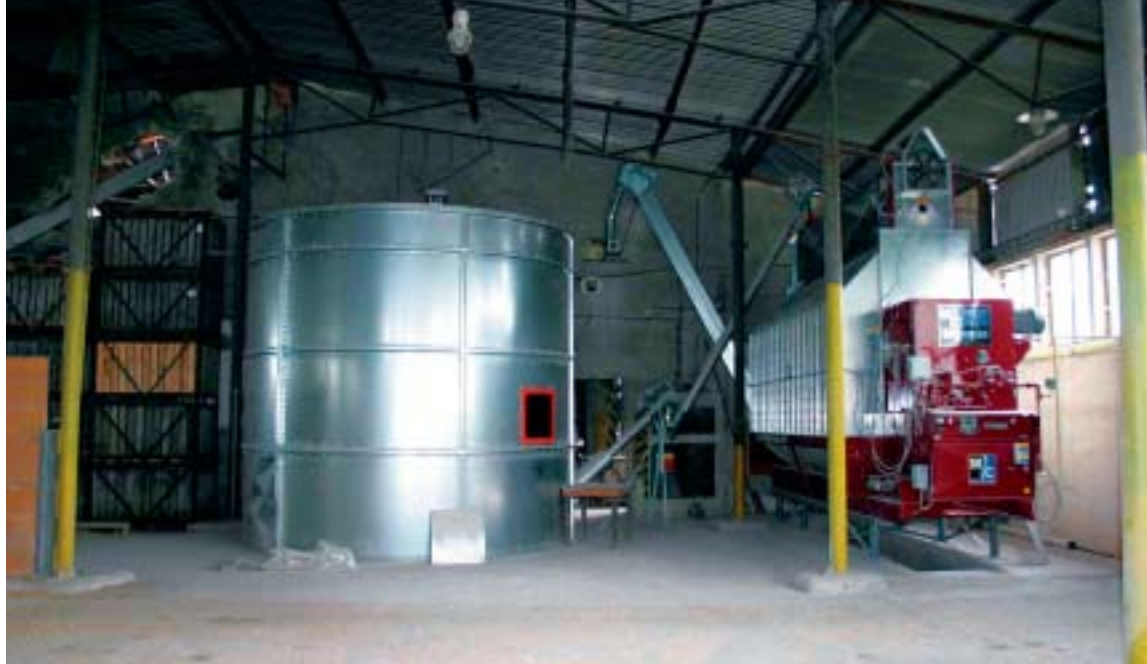
Pohled do prostoru skladů, vpravo sušička

slov méně náročné na čištění a ruční práci.