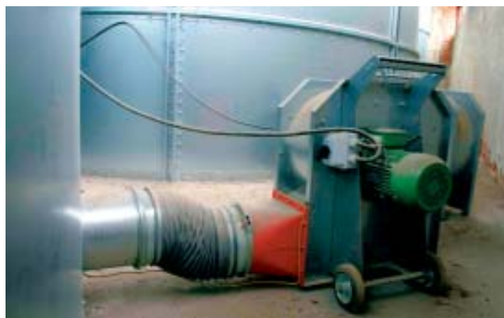
Detail provzdušňovacího zařízení zvenku

Všechny sklady jsou výsledkem spolupráce s třeboňskou společností Agrico, která Agrodružstvu nabídla nejvýhodnější podmínky. Výhodou je umístění nových sil do stávajících objektů, nemusí se tedy počítat s jejich zastřešením, a tím se celý projekt zlevní.