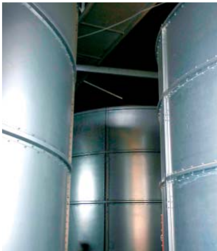
Všechna sila jsou vyrobená z pozinkovaného plechu

ny, kde byl materiál na hromádách. Protože kvalita obilí hraje v krmné dávce významnou roli, následovaly zdravotní problémy u zvířat, především u dojnic a prasnic, a spolu s tím i problémy v reprodukci," vysvětluje.