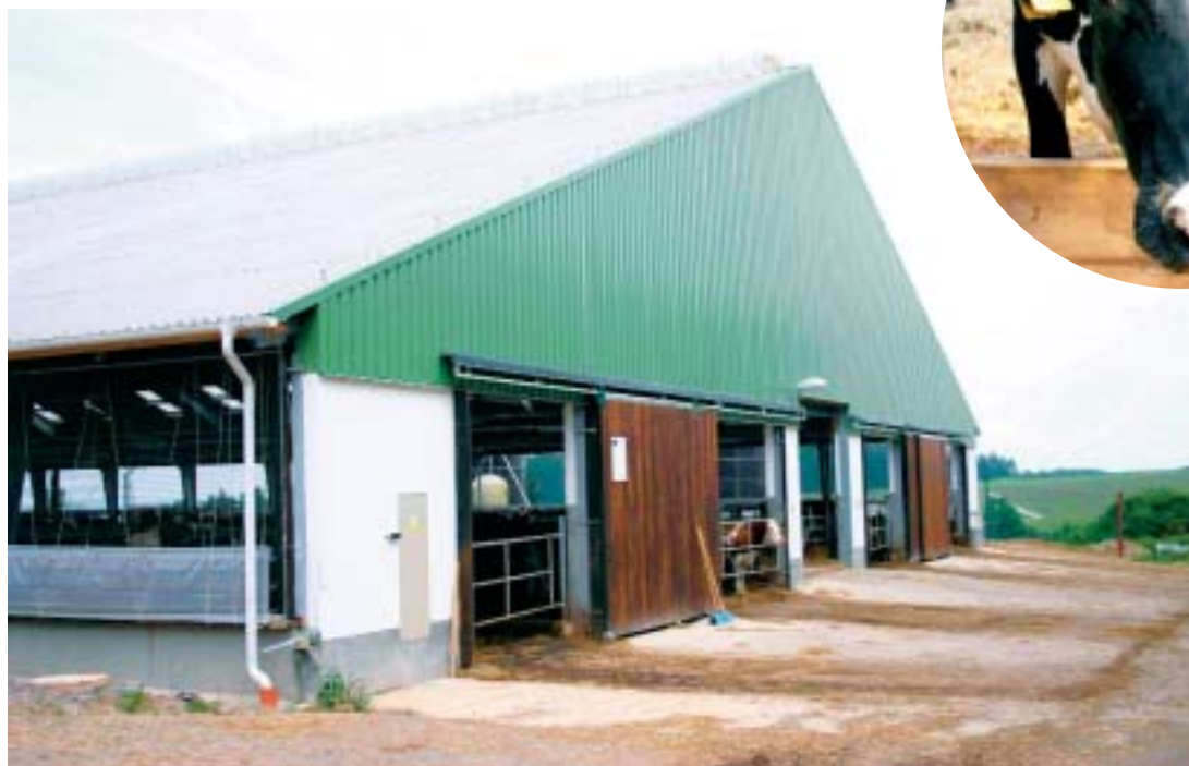
V nové stáji najdeme plemeno holštýn