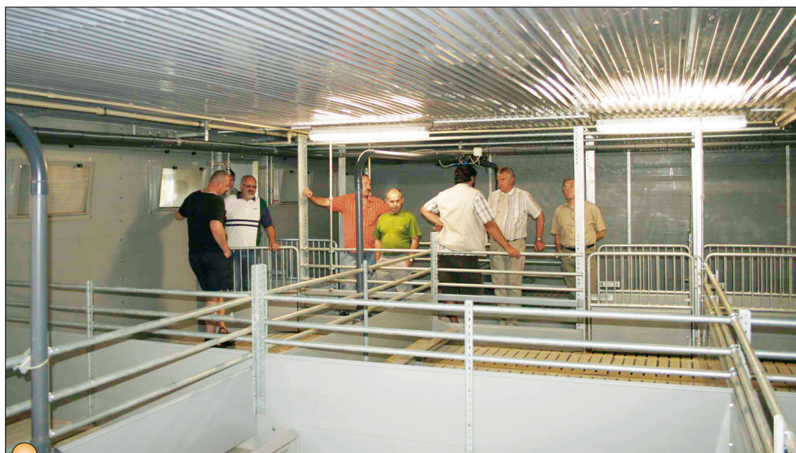
V rámci Dne otevřených dveří nakoukli návštěvníci i do sekcí pro výkrm prasat