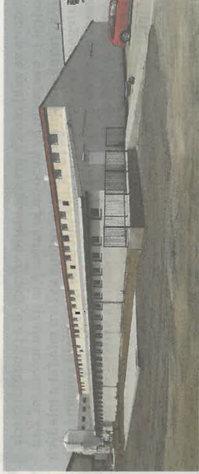
Rekonstruovaná stará výkrmna prasat

Zhruba před 5 lety v Zemědělském družstvu Haná