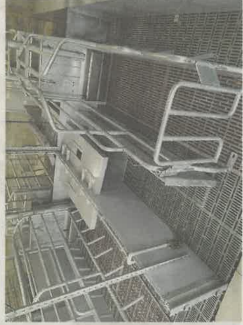
Porodní kotce jsou vybaveny plastovými rošty, plastovými vanami se špuntovým systémem vypouštění kejdy.

Ceny za vepřové, které čeští zemědělci dostávají od zpracovatelského průmyslu, jim nepokryjí stále stoupající výrobní náklady. Situace je neúnosná již delší dobu. Zdražení energií, navýšení cen všech výrobních vstupů v chovu prasat neodpovídá tržní ceně za 1 kg vepřového masa. Tento nepříznivý stav, nejistá budoucnost, malá pomoc ze strany státu, ve srovnání s některými zeměmi Evropské unie přivádí české chovatele prasat do situace, kdy končí svou činnost v tomto odvětví. I přes uvedené problémy v zemědělském družstvě na Hané věří v lepší budoucnost chovu prasat. „I v obtížné době jsme se rozhodli pro investice do živočišné výroby. Použil bych srovnání. Před několika lety investovali významné podnikatelské české skupiny do těžby uhlí. Tehdy se zdálo, že tyto investice v kontextu dnešní doby ztrácí logiku, dnes v krizi se situace výrazně mění. V chovu prasat vidím podobně, struktura živočišné výroby by měla být do budoucna zachována. Green deal je sice hezká věc, nicméně v ekonomické realitě dnešních dnů si tento projekt žádá delší časový prostor pro realizaci. Ve výrobě vepřového masa musíme být