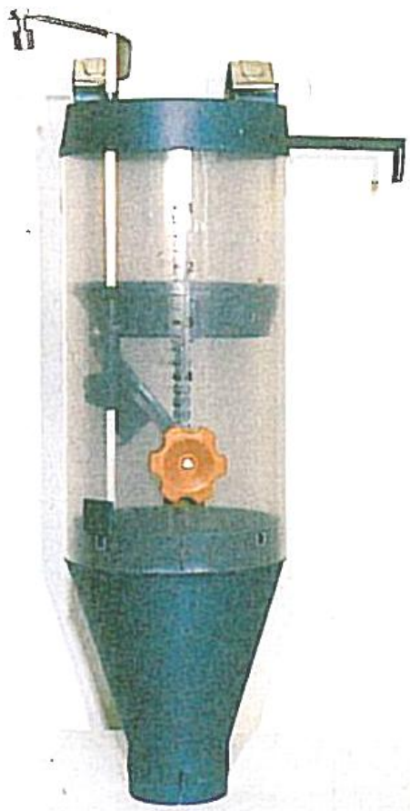
objem 6 litrů