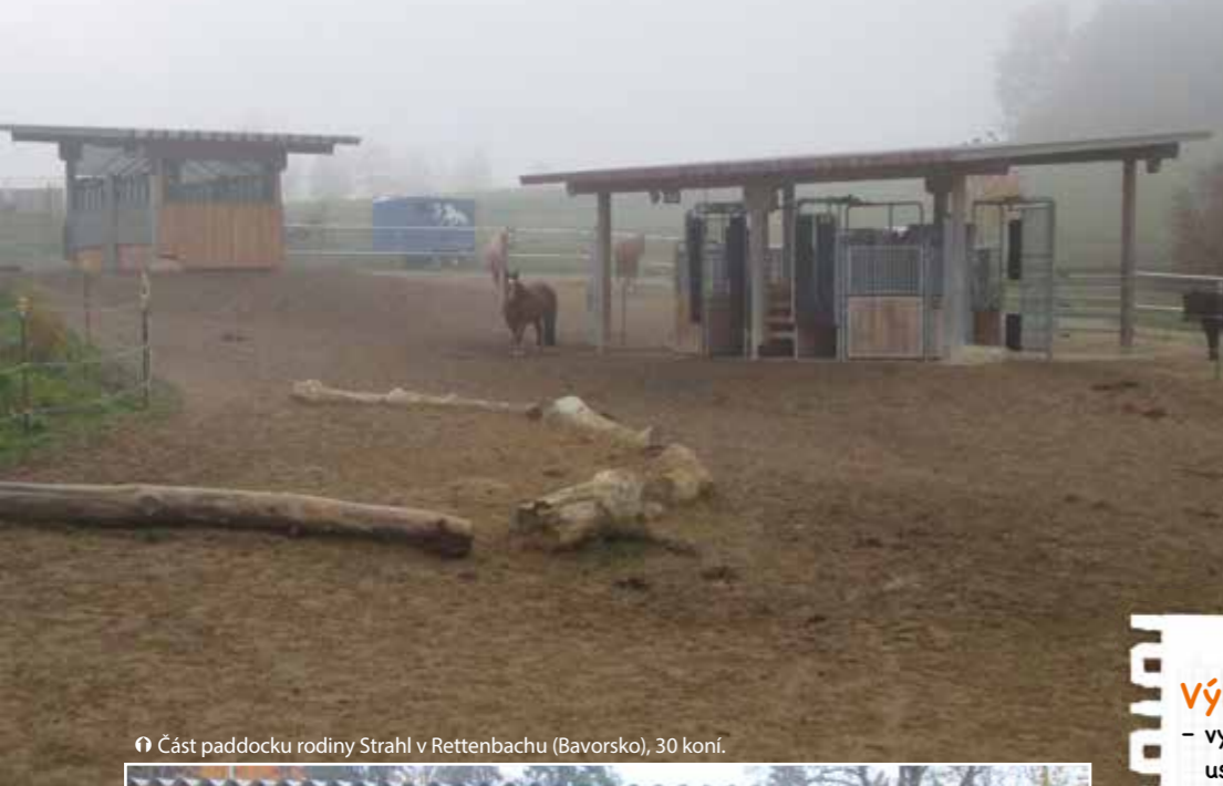
Část paddocku rodiny Strahl v Rettenbachu (Bavorsko), 30 koní.