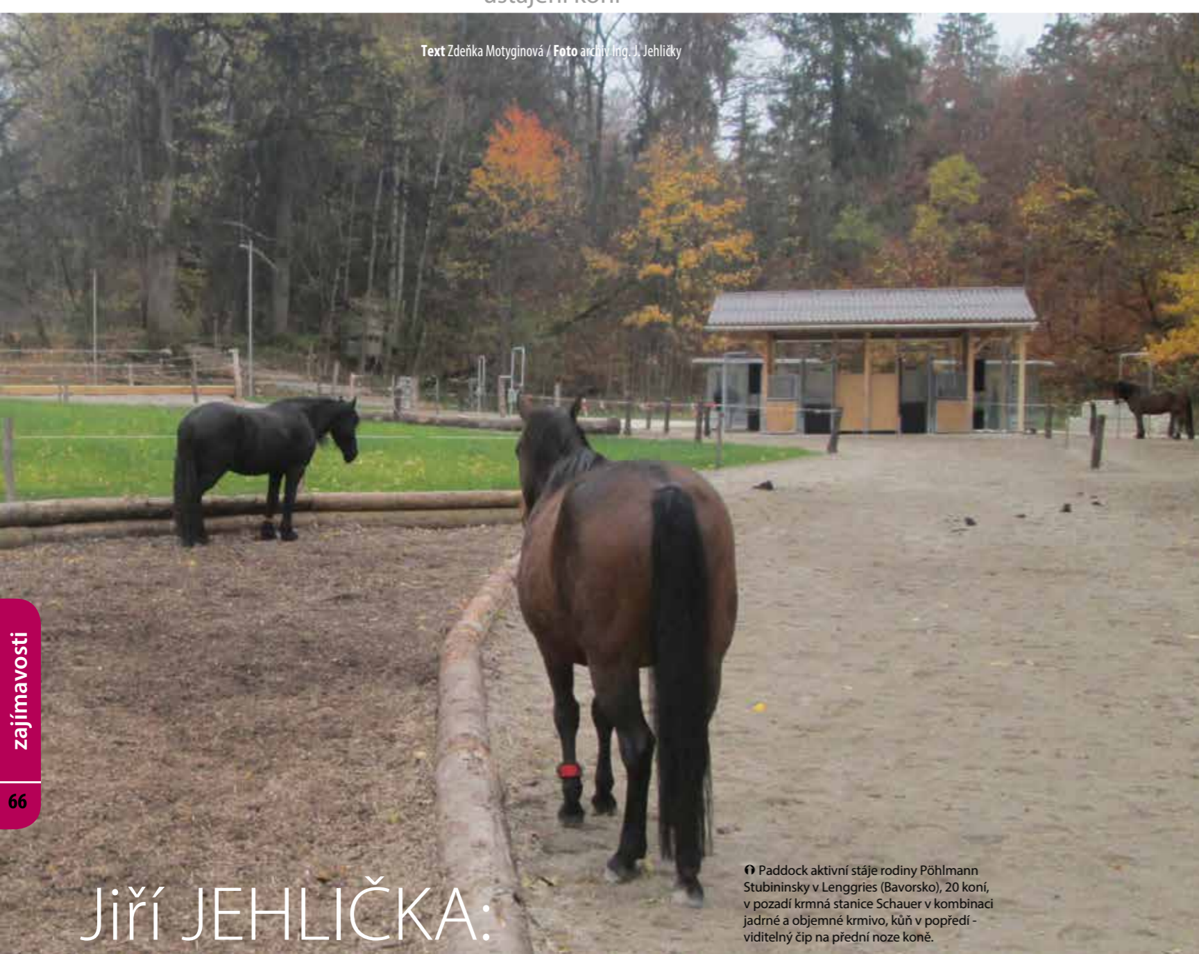
➊ Paddock aktivní stáje rodiny Pöhlmann Stubininsky v Lenggries (Bavorsko), 20 koní, v pozadí krmná stanice Schauer v kombinaci jadrné a objemné krmivo, kůň v popředí - viditelný čip na přední noze koně.

Text Zdeňka Motyginová