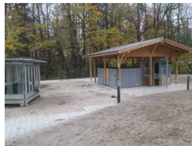
Automaty na zkrmování jadra i objemného krmiva.

Nový kůň je po příchodu do aktivní stáje nejprve umístěn v tzv. integračním boxu. Tento box je z vnější strany přístupný pro ostatní koně, a tak si koně na sebe postupně zvykají. Po dobu integrace koně je nutný zvýšený dohled ošetřovatele – ten musí koně postupně seznámit s celým areálem a jeho „nástrahami“. Délka tohoto začleňování je pochopitelně individuální, v průměru trvá dva týdny. Samozřejmě existují případy, kdy kůň nezvládne tento systém využívat, ale tyto případy jsou ojedinělé. Zpravidla se jedná o starého koně s předchozí „psychickou“ zátěží.