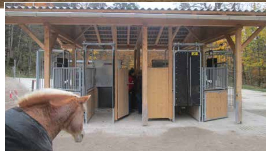
Dva vedle sebe umístěné automaty Schauer pro příjem jadra i objemného krmiva.

Optimální skupina je do 30 koní. Viděl jsem i farmy, kde bylo přes 50 koní, v takovém případě byly vytvořeny dvě skupiny.