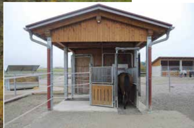
➋ Stanice s jadrným krmivem.