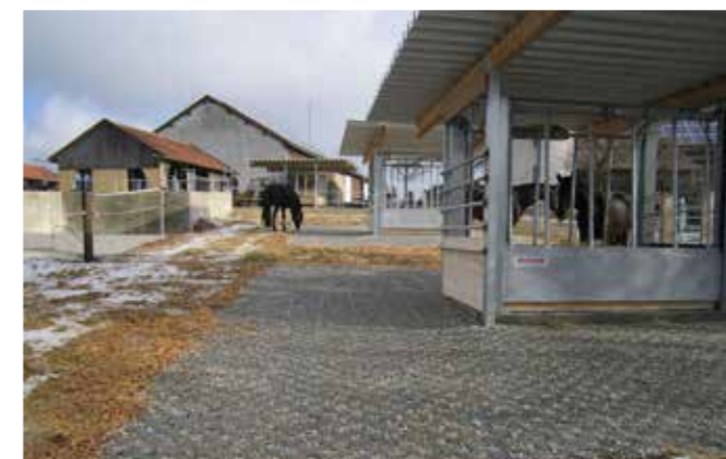
➌ Farma rodiny Kistler v Kranzbergu (Bavorsko), 45 koní – místo pro zkrmování sena.

kůň je sice domestikované zvíře, ale nemůžeme mu mluvit do všeho, zvláště když má kůň evidentně svůj názor na to, co je pro něj dobré. Aktivní stáj v uvedeném provedení je vhodný kompromis, jak v dnešním světě sladit požadavky lidí a přirozené potřeby koní.