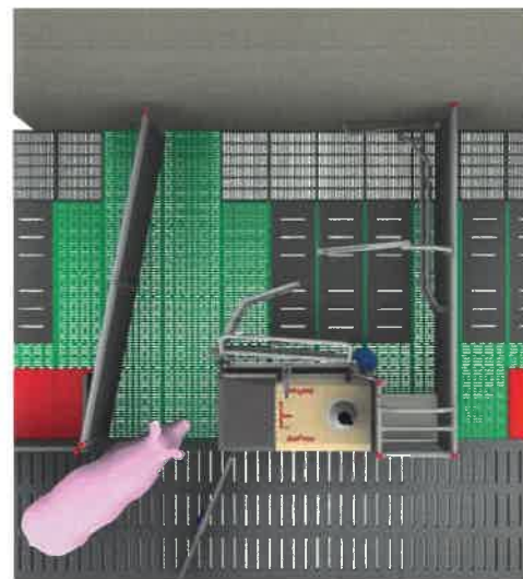
Schéma welfarového kotce beFree

Kotec značky WelCon (péče o zvířata a pohodlí farmáře) je patentovaný porodní kotec pro orgánické chovy. Kotec je navržen výzkumnými pracovníky z Institutu pro ekologické zemědělství a farmářskou biologickou rozmanitost zemědělského výzkumu a vzdělávacího centra Raumberg-Gumpenstein ve Štýrsku v Rakousku a vyrábí ho Schauer Agrotronic. WelCon Bio je kompletní systém. Byl patentován v roce 2012 a stal se novým standardem pro organické chovy prasnic v německy mluvících zemích. Prasnice má svobodnou hybu po celou dobu a může si vytvořit hnízdo, selata mají snadný přístup k mléčné žláze a mají přitom ochra-