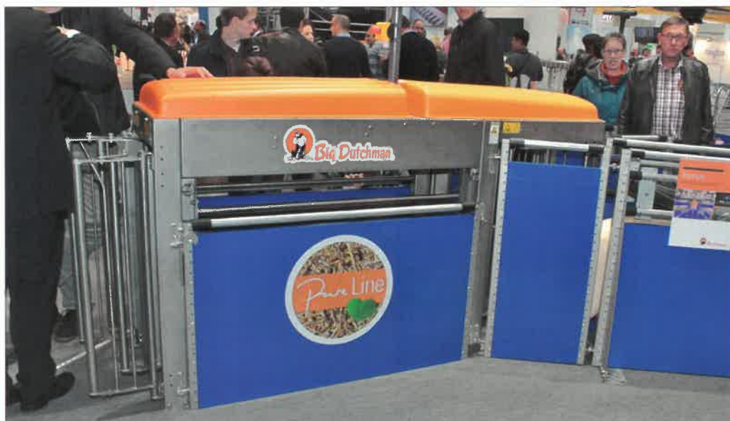
Sortovací zařízení přispívá mimo jiné k vyrovnanosti výkrmu