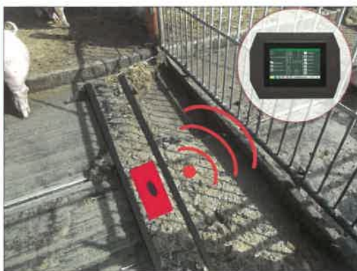
PigGuard – vyhrnovač hnoje, který je ohleduplný ke zvířatům i technologií

Schauer Agrotronic GmbH A-4731 Prambachkirchen Tel. +43/7277/2326-0* www.schauer-agrotronic.com