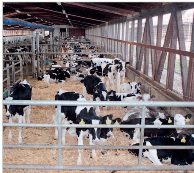
V Zemědělském družstvu věnují pohodě všech hospodářských zvířat prvořadou pozornost