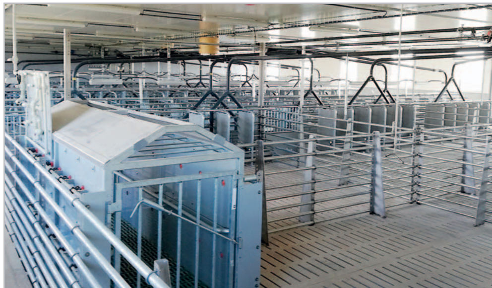
Koncem června letošního roku byla zkolaudována a uvedena do provozu nová porodna pro 300 prasníc a 100 prasníček včetně koncové jímky na kejdu

„K našemu překvapení se asi po dvou měsících ozvali domnělí účastníci stavebního řízení, kteří se cítili při schvalování stavební- ho povolení opomenuti, přesto že proběhlo veřejně,“ dodává Bohumír Hutař. „Ač bydlí na druhém konci vesnice, domnívá- jí se, že jim nová stáj způsobí ne- příjemnosti, přitom argumento- vali špatně spočítanou kapacitou jímky, nesprávným počtem do- bytých jednotek a podobně. Místní stavební úřad vzal odvolání na vědomí a stížnost postoupil