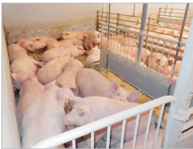
Výrazným obchodním artiklem Zemědělského družstva Hrotovice jsou prasata, ročně jich dodá na trh 8 až 9 tisíc

nadřízenému krajskému úřadu. Ten si k tomu nechal vypracovat všechna nezbytná stanoviska a poté stížnost zamítl jako neo- právněnou, pouze nechal doplnit stanovisko vodního hospodář-