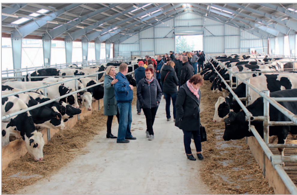
Dny nové technologie se v Hrotovicích konají téměř se železnou pravidelností, pokaždé se jich zúčastňuje velké množství chovatelů

V souvislosti s pandemií se sa- mi přesvědčujeme, že domácí potraviny a potravinová sobě- stačnost budou hrát v budoucnu